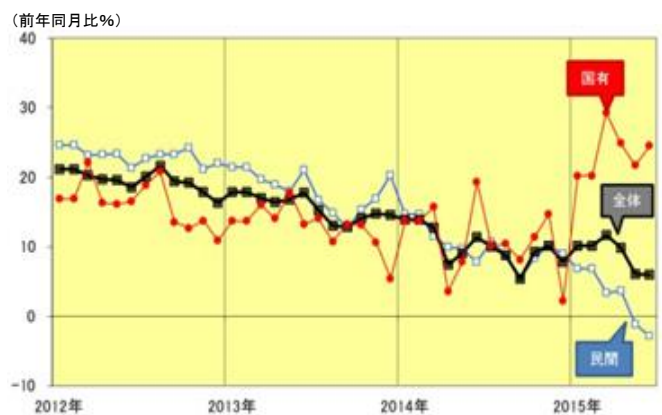
固定資産投資（国有と民間）の推移

(資料) CEIC (出所は中国国家統計局)のデータを元にニッセイ基礎研究所で推定 (注) 累計で公表されるデータを元に推定、1・2月は共に2月時点累計(前年同期比)