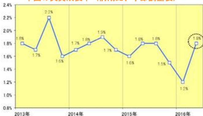
中国の実質成長率（前期比、季節調整後）

1 2016年上期（1-6月期）の中国経済を振り返ると、1-3月期には景気が下振れしたものの、4-6月期にはやや持ち直すこととなった。4-6月期の実質GDP成長率は前年同期比6.7%増と市場の事前予想（同6.6%増）を上回る結果となり、前期比では1.8%増（年率換算すれば7.4%前後）と2016年の成長率目標（6.5-7%）を上回る伸びを回復、工業生産者出荷価格の下落ピッチが鈍化して“名実逆転”は解消、デフレ圧力はやや緩和した。